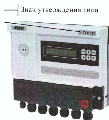
Корректор СПГ763. Общий вид.